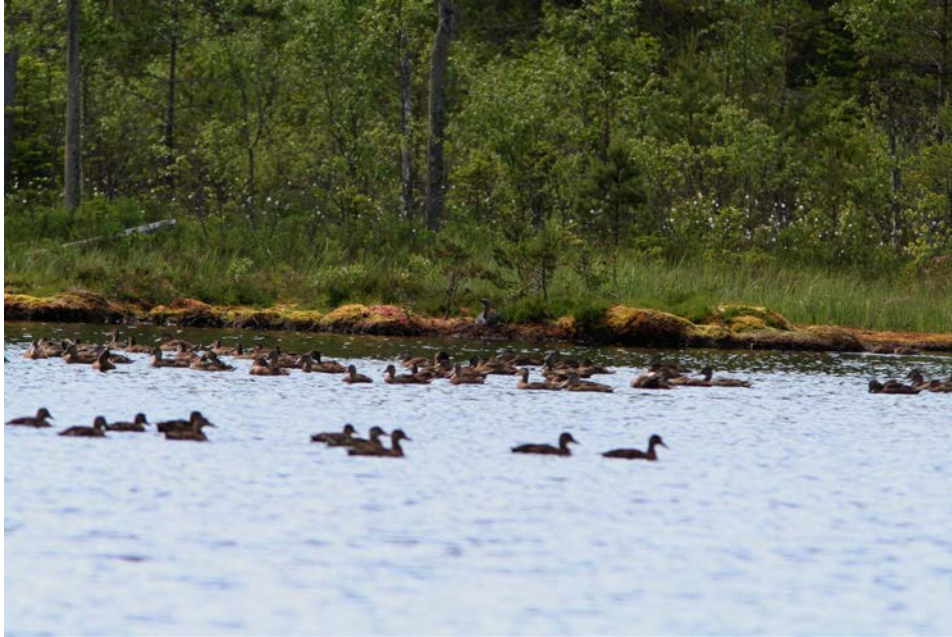
Utplanterade gräsänder och en ruvande smålom på stranden i bakgrunden. Lommen tröttnade på änderna och häckningen avbröts.